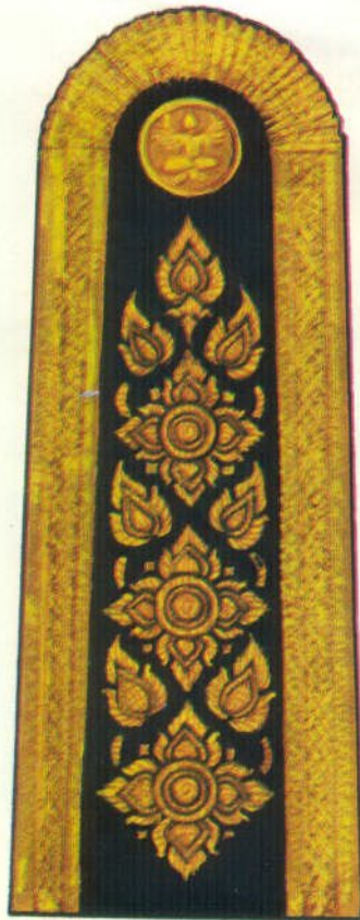
แบบอินทรรณูแข็ง