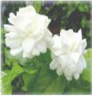
ดอกกุหลาบ