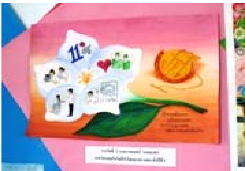
2.2 ผลงานภาพวาด สื่อความหมายความเป็นสหเวชศาสตร์