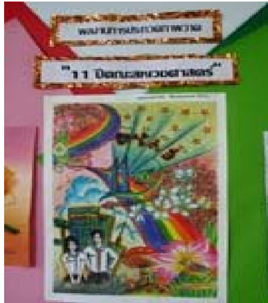
2.3 ผลงานการวาดภาพ รางวัลชนะเลิศ อันดับ 1