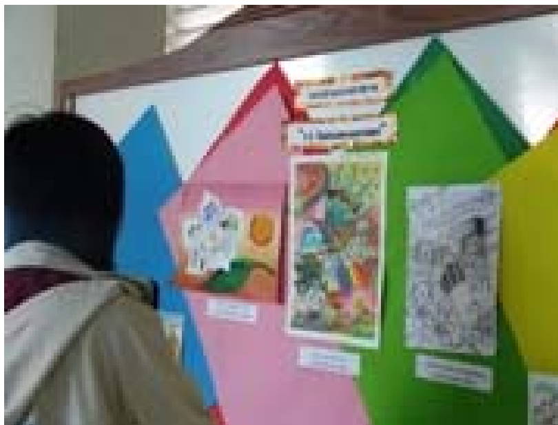
2.1 นิทรรศการภาพวาด ผลงานของนิสิตคณะสหเวชศาสตร์