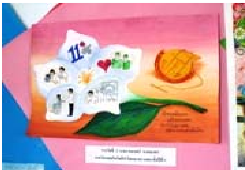
2.2 ผลงานภาพวาด สื่อความหมายความเป็นสหเวชศาสตร์