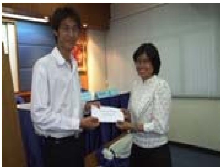
2.6 โฉมหน้าผู้ที่ได้รับรางวัลในการประกวดผลงานภาพถ่าย