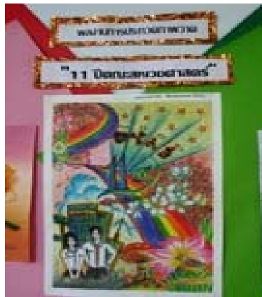
2.3 ผลงานการวาดภาพ รางวัลชนะเลิศ อันดับ 1