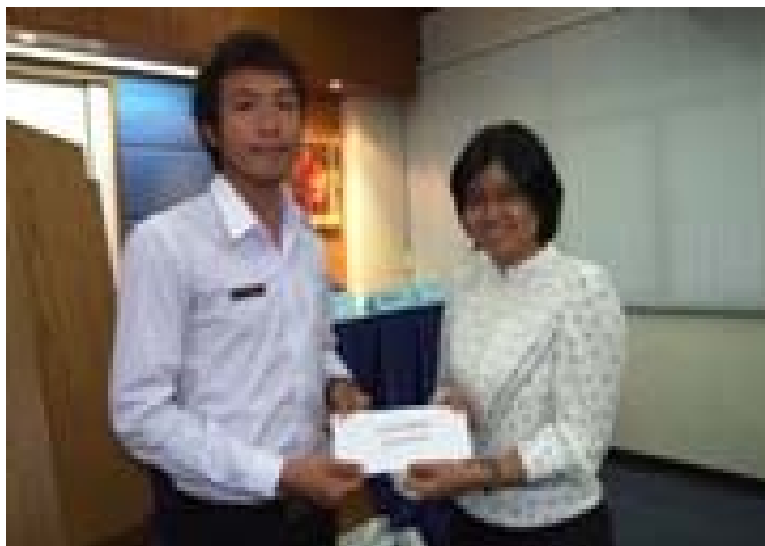
2.5 โฉมหน้าผู้ที่ได้รับรางวัลในการประกวดผลงานวาดภาพ