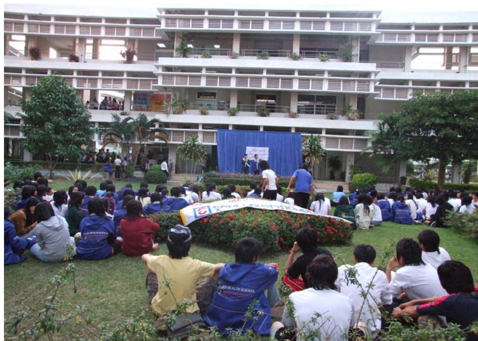
รูปที่ 2.4 นิสิตคณะสหเวชศาสตร์ให้ความสนใจฟังคำปราศรัยของผู้สมัครฯ