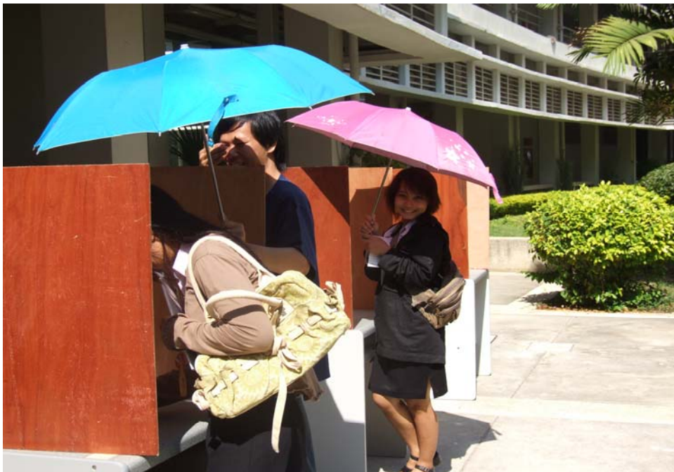
รูปที่ 2.6 นิสิตคณะสหเวชฯ ตระหนักหน้าที่ และใช้สิทธิของตนเอง ตามหลักประชาธิปไตย