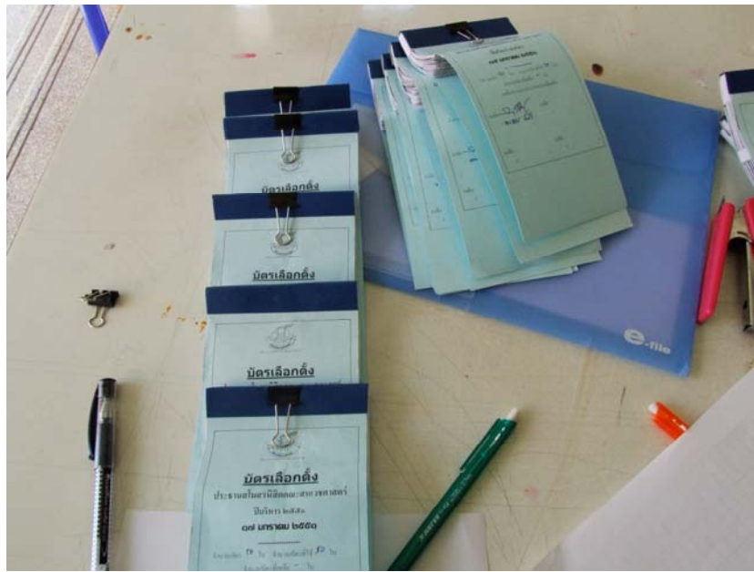
รูปที่ 2.7 ระบบการดำเนินการ เกี่ยวการเลือกตั้งประธานสโมสรนิสิตคณะสหเวชศาสตร์