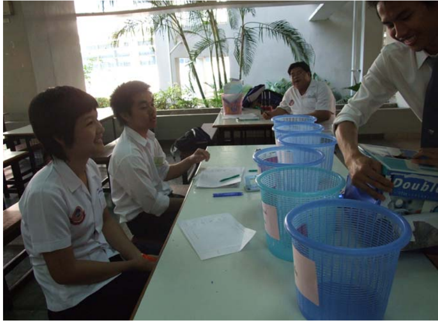
รูปที่ 2.9 บรรยากาศในการนับบัตรคะแนน ต่อนักกรรมการฯ ดูแลการนับคะแนน