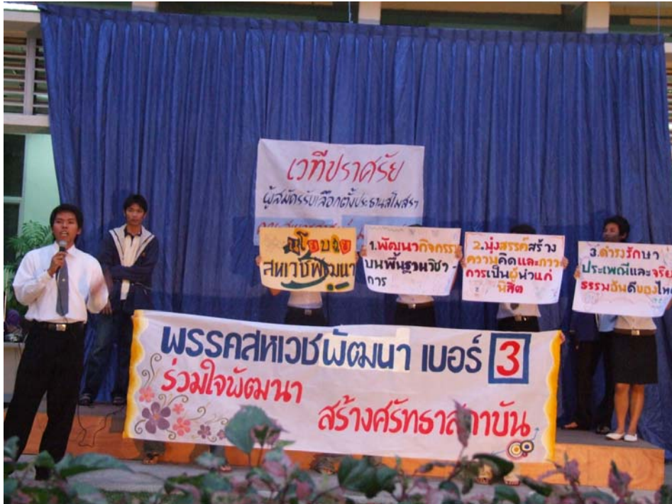
รูปที่ 2.3 ผู้สมัครปราศรัยหาเสียง