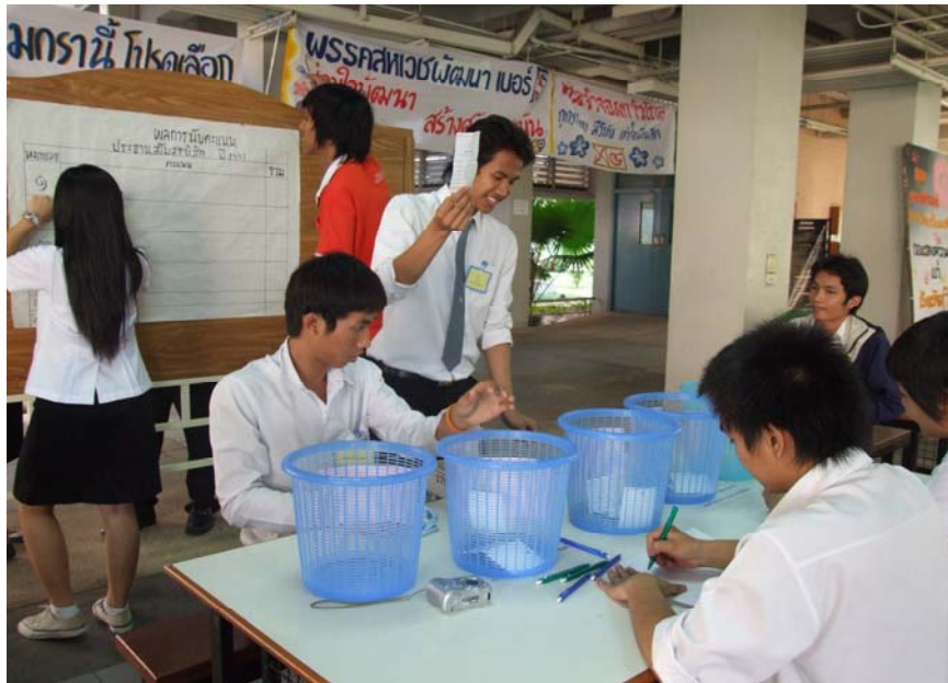
รูปที่ 2.10 ตรวจนับคะแนน