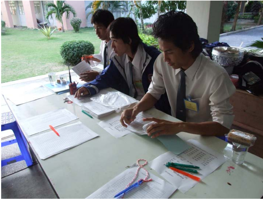
รูปที่ 2.5 ณ หน่วยเลือกตั้งประธานสโมสรนิสิตคณะสหเวชศาสตร์