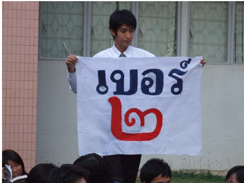
รูปที่ 2.2 โฉมหน้าผู้สมัครหมายเลข 2