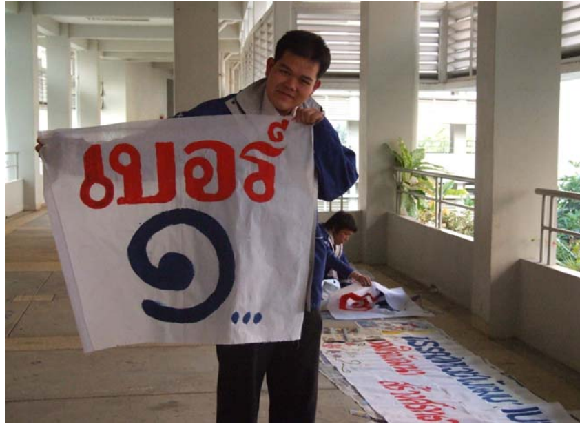
รูปที่ 2.1 โฉมหน้าผู้สมัครหมายเลข 1