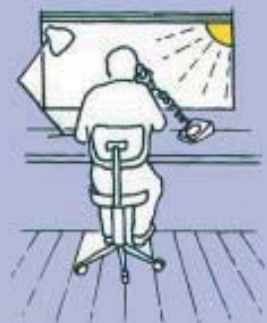
8. Supervising print