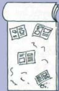
2. Thumbnail designs