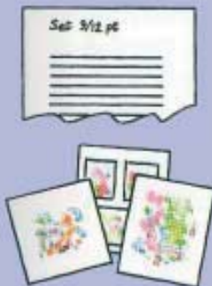
5. Typesetting and illustration