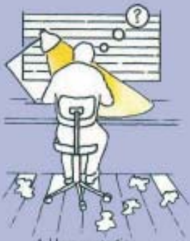
1. Ideas generation