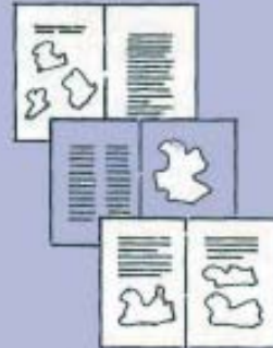
3. Working roughs