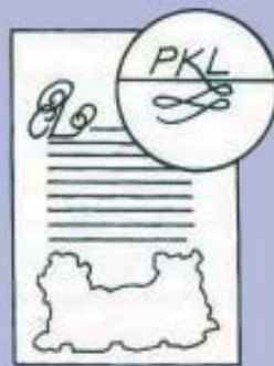
6. Preparing artwork