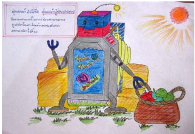
4. ด.ญ. ธนวรรณ เวชธานี โรงเรียนบ้านกุดเม็ก อ. กุดรัง จ. มหาสารคาม