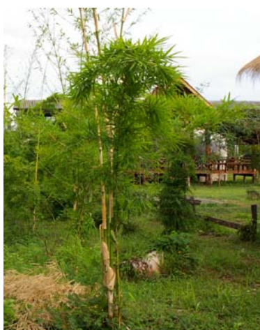
โครงการไม้เลื้อยน้อง โรงเรียน ดอนถ่อนโคกกลางวิทยา จ.นครพนม

ไผ่เอ๋ยไผ่เลื้อย ดูเจ้าช่างขยันแตกกิ่งกอ เจ้าเป็นไม้มีประโยชน์สารพัด ต้นจักสานเครื่องมือไว้ทำกิน สานส้อมช้อนกระบุงมุงยั้งฉาง สานกระติบสิ่งประดิษฐ์ลดต้นทุน เจ้าเป็นไม้เลื้อยน้องคนเขาวัว ไซว่าแกล้งยกยอปับนปอกิน ช่างเอื้อเฟื้อเผื่อแผ่แก่ผู้อื่น หากคนเป็นเช่นเจ้าทั่วแผ่นดิน