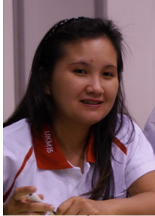
เจ้าของเรื่องเล่า

เรื่องเล่าประจำกลุ่มที่ 5 เรื่องเล่าที่ 6