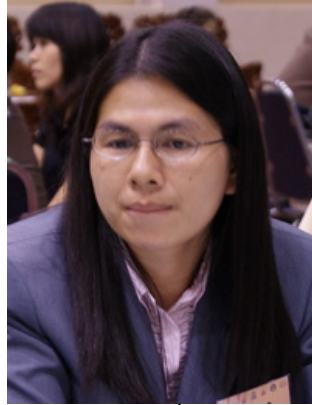
เจ้าของเรื่องเล่า

เรื่องเล่าประจำกลุ่มที่ 5 เรื่องเล่าที่ 1