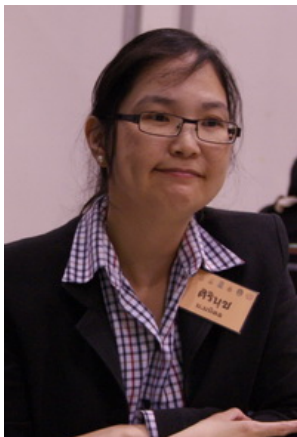
เจ้าของเรื่องเล่า

เรื่องเล่าประจำกลุ่มที่ 5 เรื่องเล่าที่ 5