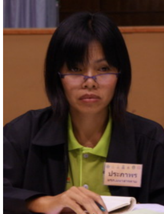
เจ้าของเรื่องเล่า

เรื่องเล่าประจำกลุ่มที่ 5 เรื่องเล่าที่ 8