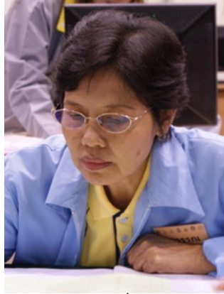
เจ้าของเรื่องเล่า

เรื่องเล่าประจำกลุ่มที่ 5 เรื่องเล่าที่ 3