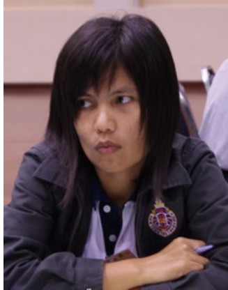
เจ้าของเรื่องเล่า

เรื่องเล่าประจำกลุ่มที่ 5 เรื่องเล่าที่ 2