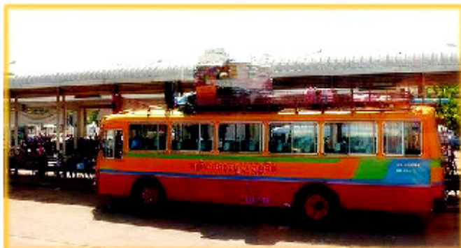
(บน) รถโดยสารคันยาว วิ่งไกลมาจากจากประเทศจีนในน (ล่าง) นี้แหละครับ “สกายแลป”

ยังมีรถยนต์ที่วิ่งภายในเมืองอีก 2 แบบ คือ รถยนต์จักยานยนต์สามล้อ เป็นรถที่วิ่งภายในเมืองอย่างที่บ้านเราเรียกว่า “สกายแลป” เป็นรถที่คนไทย