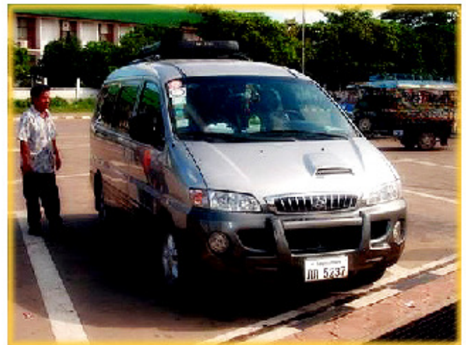
รถยนต์ “ซุนโด” พบเห็นทั่วไปในเมืองลาว

ภาคภูมิใจเป็นพิเศษ เพราะว่า เครื่องยนต์เป็นของเก่าประมาณไม่เกิน 150 ซี.ซี. แต่บรรทุกได้เป็น 10 คน ผมจำได้ว่าเคยพาชาวญี่ปุ่นไปดู “เจ้าสกายแลป” ญี่ปุ่นยังงง...บอกว่าทำได้อย่างไร ว่าแล้วเขาก็จัดแจงถ่ายรูปพร้อมกับพวกเรา โดยให้ถ่ายรูปชาวญี่ปุ่นติดไปด้วย ความจริงเราก็ไม่รู้ว่าทำไมต้องเน้นถ่ายรูปชาวญี่ปุ่นไปด้วย มารู้ภายหลังว่าชาวญี่ปุ่นจะเอารถไปฝากให้สถาบันวิจัยเขาศึกษาต่อ โดยเขาจะบอกความสูงของหนุ่มญี่ปุ่นไปด้วย ...ผลหรือครับ! ก็เรียบร้อยโรงเรียนปลาตีบซิคครับ ขายสินค้าได้สารพัดอย่าง