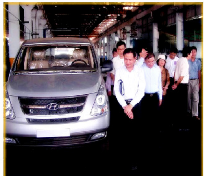
ผู้เขียน และคณะศึกษาดูงาน เยี่ยมชมบริษัท Kolao Developing

เมื่อพูดถึงรถบรรทุกขุดนิคมของ สปป.ลาว แล้ว ดูเหมือนจะเป็นรถยนต์เกาหลี ยี่ห้อ Hyundai เลยขอนำเรื่องที่ได้รู้จากการไปศึกษาดูงานที่ แขวงสะหวันนะเขต ตอนนั้นพอดีผมได้ไปศึกษาดูงานที่ บริษัท KOLAO Developing Co.,Ltd ซึ่งเป็นบริษัทที่ลงทุนจากประเทศเกาหลีใต้ 100% เพื่อประกอบรถจักรยานยนต์ และตัดแปลงรถบรรทุกเก่า เริ่มก่อตั้งในปี ค.ศ. 1997 เซาที่ดินเป็นเวลา 35 ปี พื้นที่ประมาณ 20 ไร่ มีคนงาน 685 คน มีพนักงานเป็นชาวเกาหลี 5 คน ชาวจีน 3 คน นำเข้าชิ้นส่วนเก่า CKD จากประเทศเกาหลีใต้ 100% และชิ้นส่วนบางอย่างเช่น วงล้อยางล้อ และโช้ นำเข้าจากประเทศไทย โดยส่งขายภายในตลาด สปป.ลาว เท่านั้น