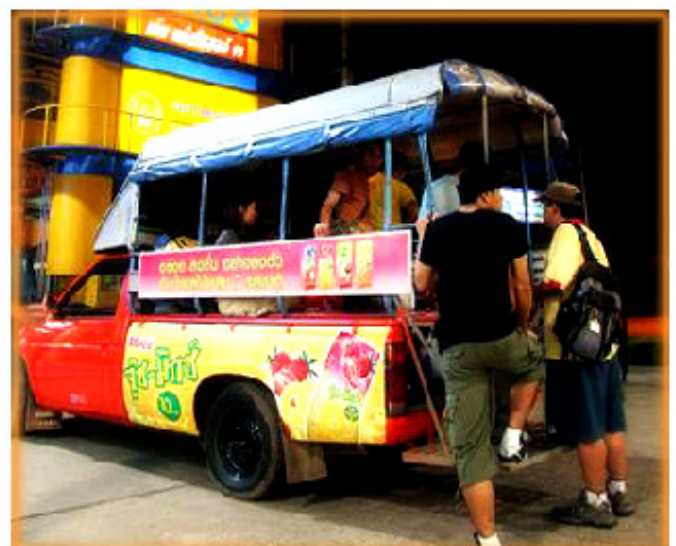
รถกะบะ (คล้ายๆ สองแถวบ้านเรา) รับ-ส่งผู้โดยสารระยะไกล

รถยนต์บรรทุกเล็ก ขนาดไม่เกิน 1 ตัน หรือที่เรียกกันว่า รถกะบะ เป็นรถที่วิ่งได้ไกลกว่าเจ้าสกายแลป รู้สึกว่าหลังคารถของ สปป.ลาว จะสูงกว่าของประเทศไทย