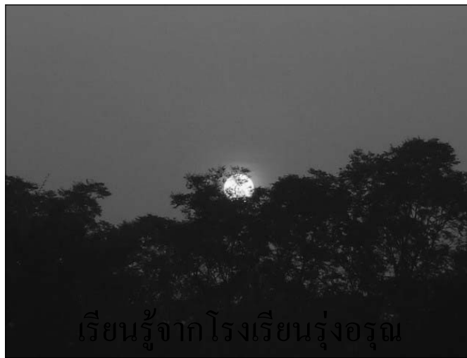
เรียนรู้จากโรงเรียนรุ่งอรุณ